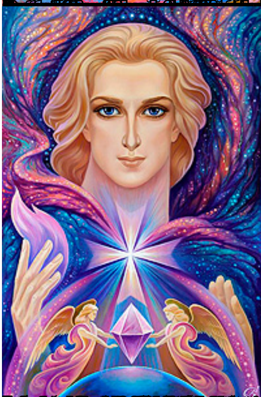
Икона, посвященная Святой Марии,