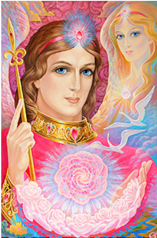
Икона, посвященная Святой Даме,