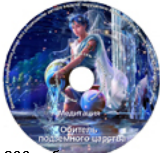
©2009г. М.Б.Н. «Обитатели подземного царства» - студийная запись