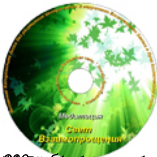
©2009г. М.Б.Н. «Медитация Света Взаимопроекции» - студийная запись