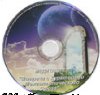
©2009г. М.Б.Н. «Встречи с Кураторами Межгалактического Союза» - студийная запись