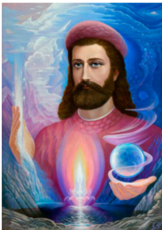
Создание Сети Преображения

Пространственный Огонь полностью войдет в земную сферу, очищая ее от всех демонических наслоений и поднимая частоту вибраций всех ее подпланов. Для людей нет иного способа выдержать накал Огненной Стихии, кроме как приступить к эволюционному преобразению мира. Каждая группа человеческих существ, устремившаяся к овладению основами построения Иерархически законных отношений и опытом Созидания в каком-то одном из направлений труда в Единой Сфере Сопряжения, создаст Магнит. Когда люди объединятся с целью построения Пространственных Магнитов, они войдут в Планетарное Служение и станут Магнитными Группами. Созидая и осуществляя Сотрудничество друг с другом, эти Магнитные Группы способны создать Огненное Облачение для всей нашей Планеты и обеспечить благостную трансформацию Пространственного Огня. Ниже мы приводим Послание Вознесенного Владыки, переданное в 2000 году, в котором перед всеми духоносцами Расы Планетарной ставится задача создания единой Магнитной Сети, действующей в подчинении Единому Богуруководству: