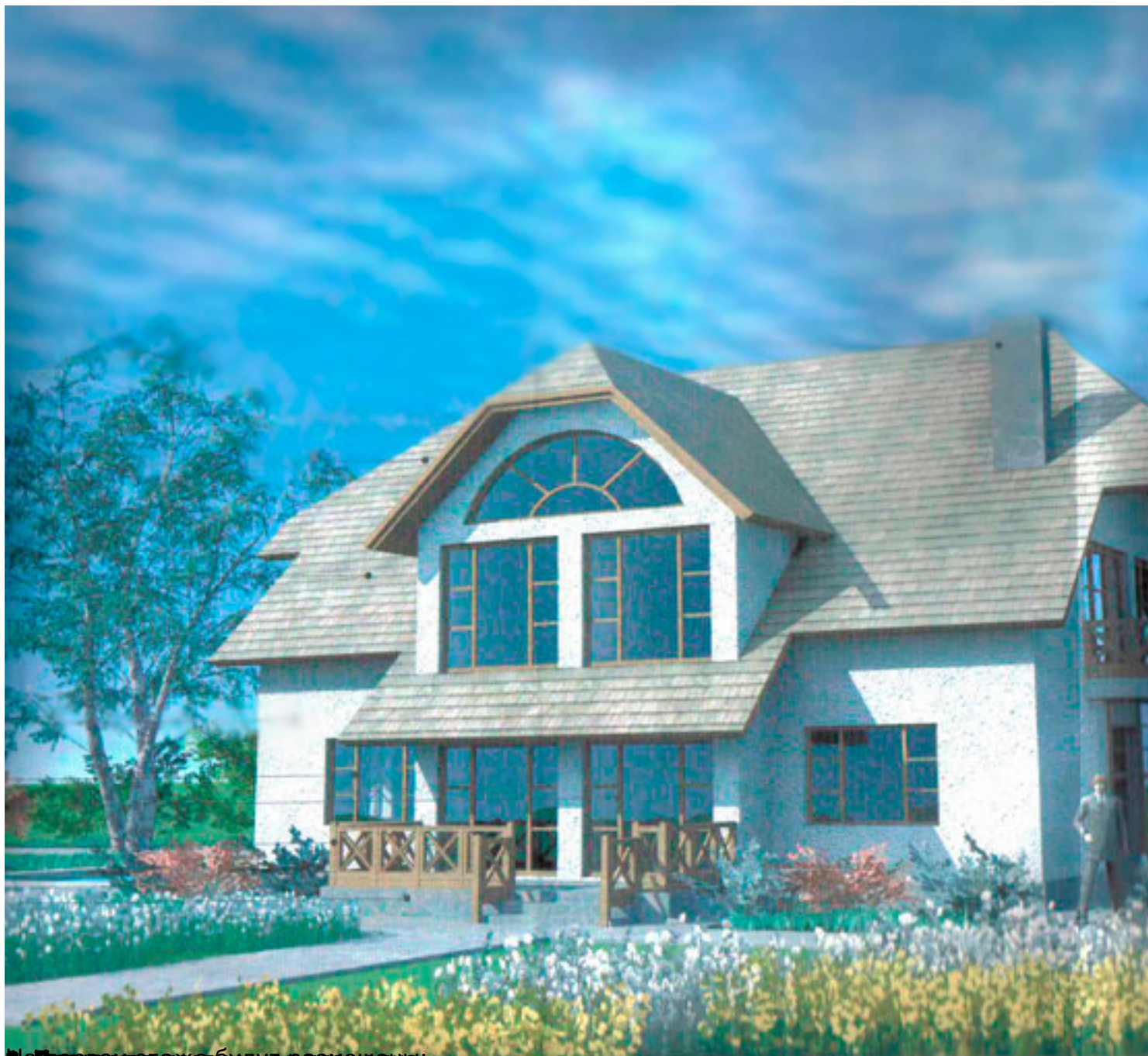
Примерное изображение участка: